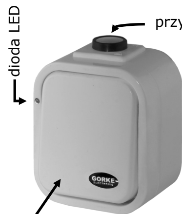
dioda LED przycisk kasowania - kod 2 klawisz - kod 1